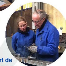
Apport de compétences