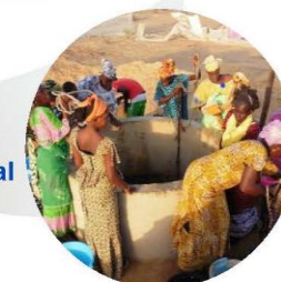
En France et à l'International